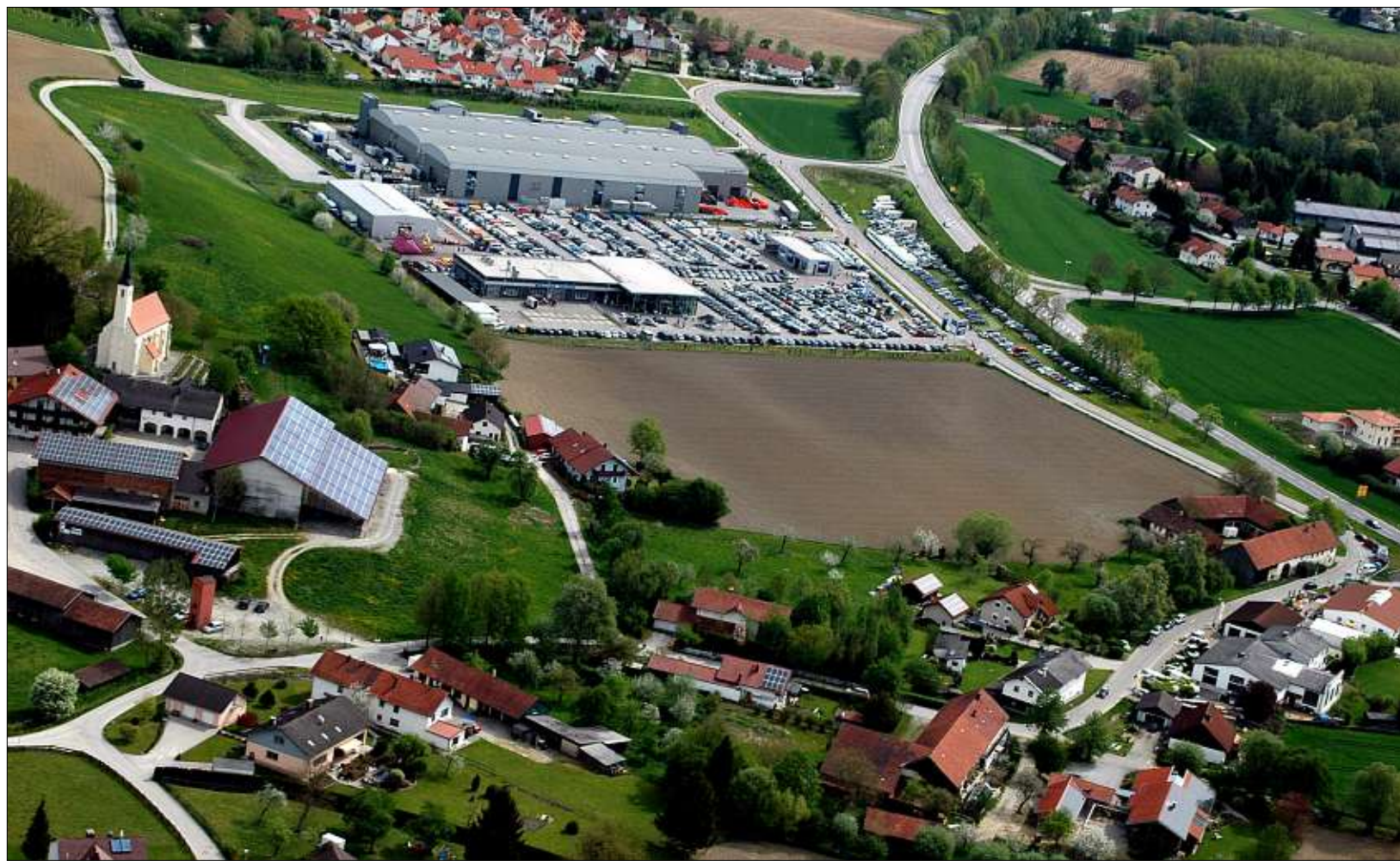
Aus der Vogel-Perspektive: Ruhstorfs neue „Markt-Drehscheibe“ zwischen Auto Schuster (Bildmitte/Gewerbegebiet Hackerwiese) und Landtechnik Silbereisen (rechts unten/Rothhof). Der dritte Schau-Sonntag mobilisierte erneut tausende Besucher. – Fotos: Nöbauer

Ruhstorf. 29 Grad am 29. April, größtenteils weißblauer Föhnhimmel, attraktives Rahmenprogramm: Am bislang zweitbesten Apriltag seit Beginn der Wetteraufzeichnung im vorletzten Jahrhundert rannten tausende Schaulustige des gesamten Rottaler, Passauer sowie sogar Innviertler Raumes bei der dritten Rotthofer „PS-Show“ buchstäblich offene Türen von Automobile Schuster und Landtechnik Silbereisen ein.