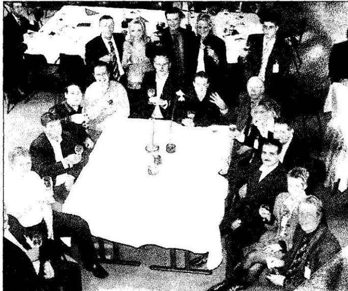
Ein Prosit auf den neuen Autotempel.